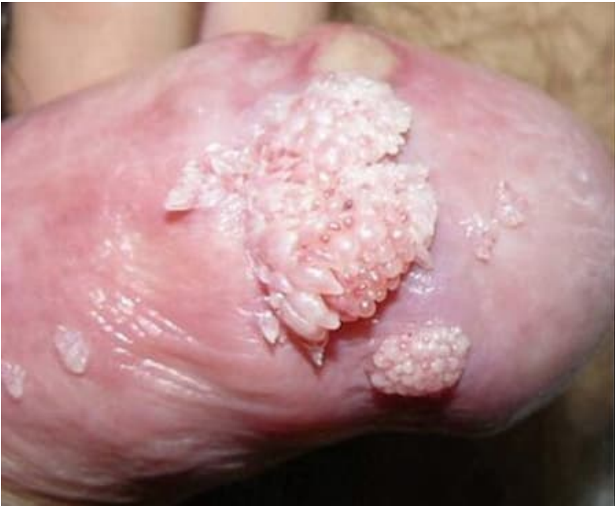
Hình ảnh bệnh lý sùi mào gà ở rãnh lớp da bọc dương vật