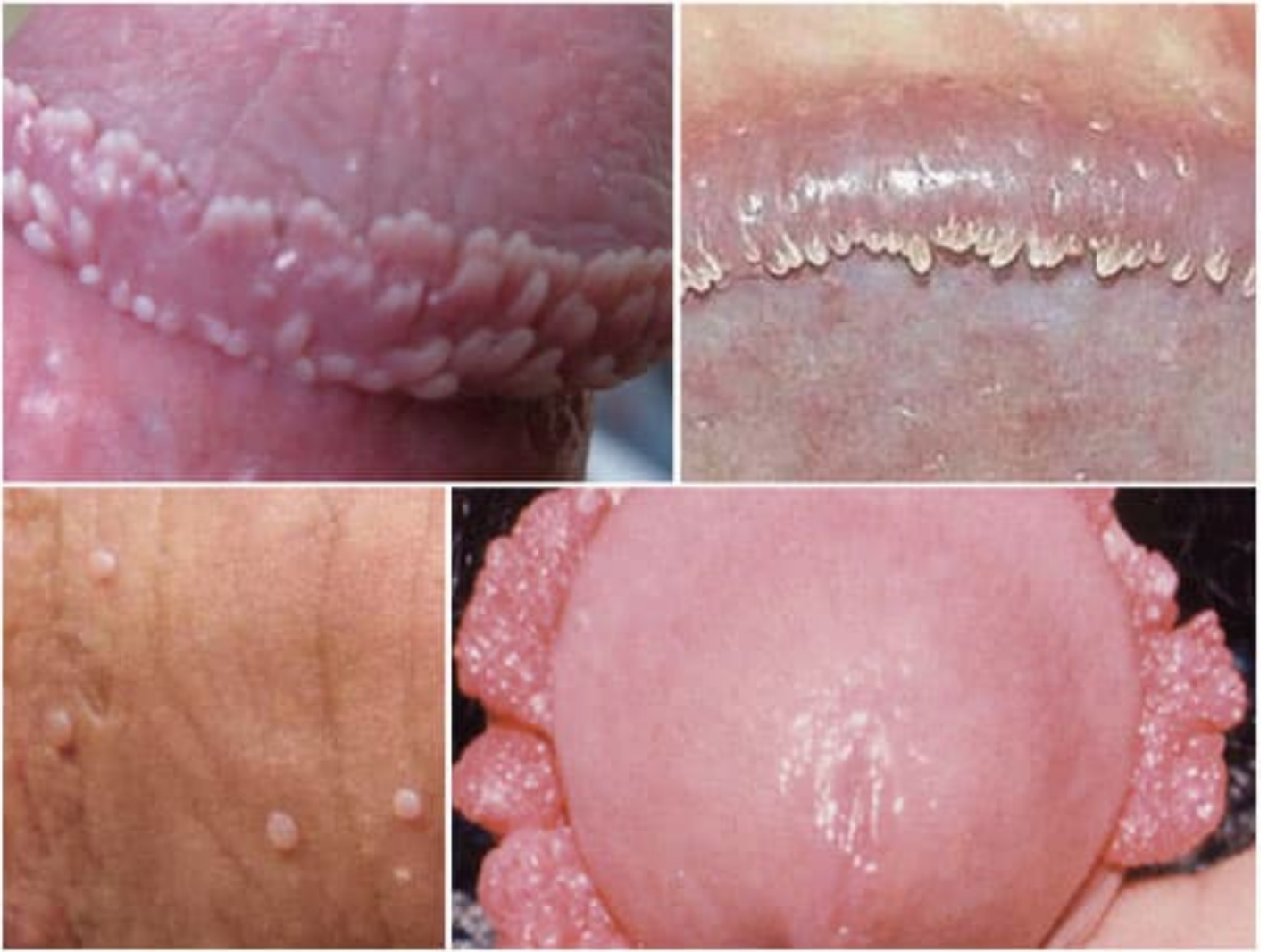
Hình ảnh sùi mào gà ở rãnh lớp da bọc dương vật