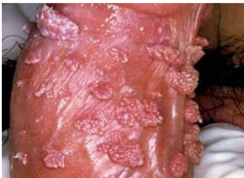
Hình ảnh bệnh mào gà giai đoạn cuối ở dương vật