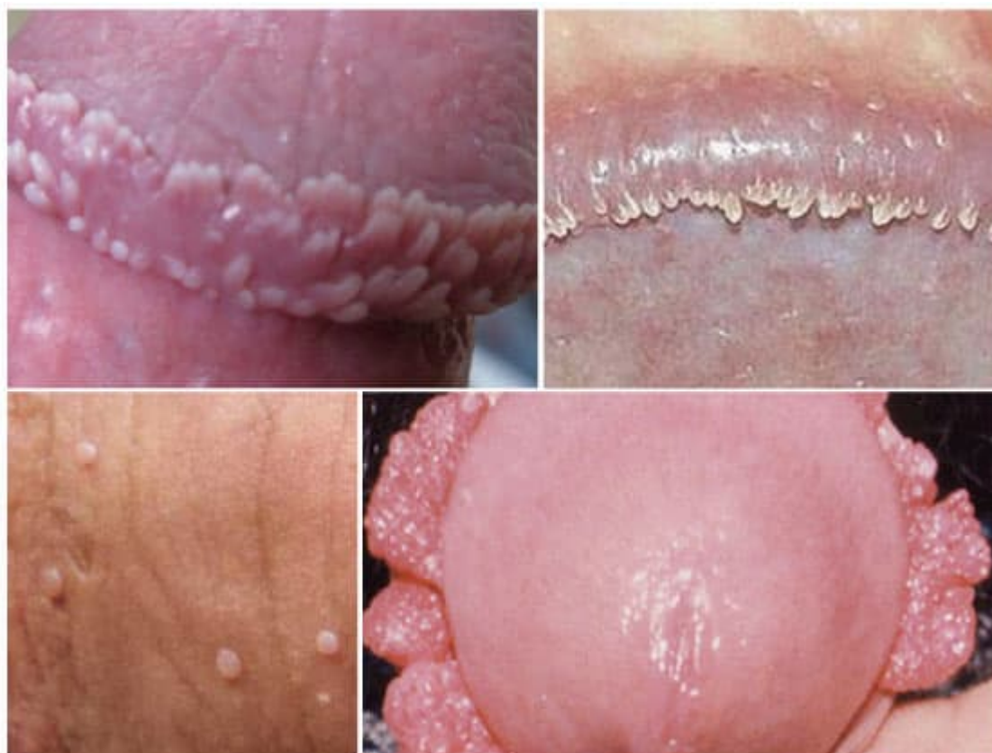
Hình ảnh bệnh mào gà ở dương vật