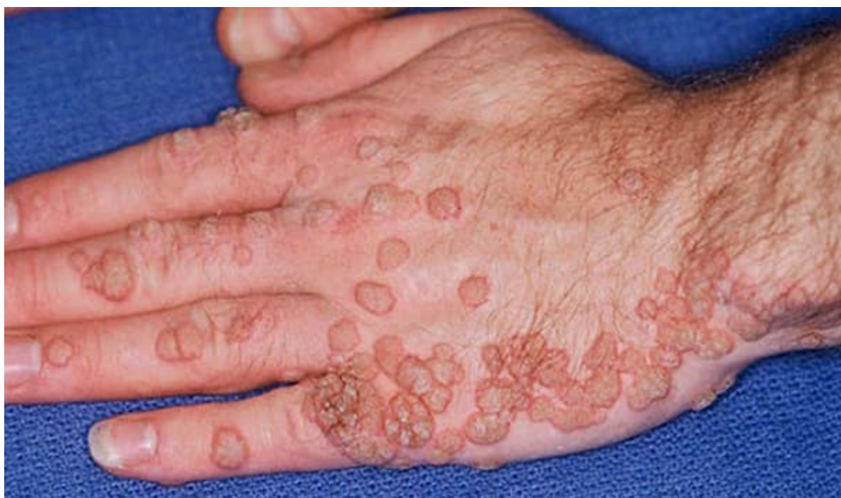
Hình ảnh bệnh mào gà ở bàn tay

Phía ngoài những hình ảnh bệnh mào gà thấy ở vị trí như khoang miệng, mắt, hậu môn trực tràng thì trong 1 số trường hợp bạn cũng có khả năng gặp hình ảnh bệnh mào gà ở tất cả mọi người giới thấy ở rất nhiều vị trí không giống như bẹn, tay, chân, chán,...Hình ảnh bệnh mào gà ở những bộ phận này thường rất dễ phát hiện, nhưng mà rất nhiều tình huống người bị bệnh xem nhẹ thường nhầm tưởng bệnh mào gà với những dạng u nhú, bệnh mụn rộp sinh dục lành đặc tính không giống.