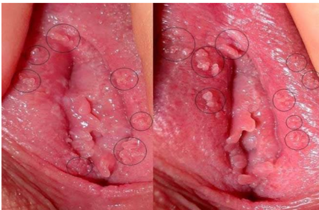
Hình ảnh bệnh mào gà ở "cô bé"

Phụ nữ thường phát hiện hình ảnh bệnh mào gà không dễ dàng hơn nam giới vì sự không giống về cấu tạo của bộ phận sinh dục. Những dấu hiệu bệnh mào gà ở phụ nữ thường không quá điển hình nên dễ thực hiện bị nhầm tưởng sang những chứng bệnh phụ khoa không giống. Hình ảnh bệnh mào