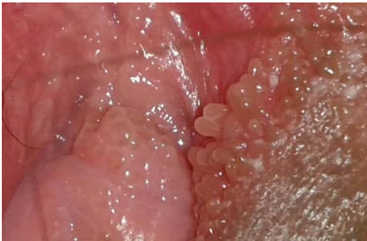
Hình ảnh nốt bệnh mào gà bên trong "cô bé"