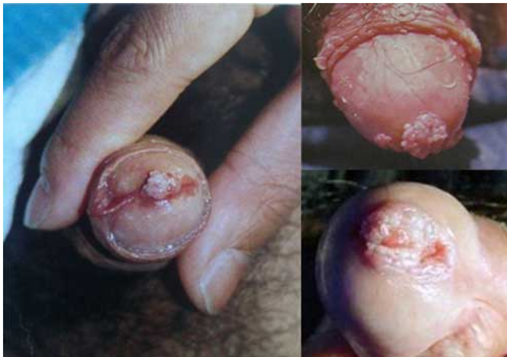
Hình ảnh bệnh mào gà bên trong dương vật