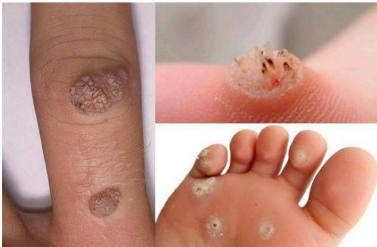
Hình ảnh bệnh mào gà ở chân tay